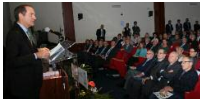
A coronare la serata, l'intervento del presidente nazionale Massimiliano Giansanti .

A concludere la cerimonia il presidente nazionale di Confagricoltura, Massimiliano Giansanti : "Se si è arrivati al centenario vuole dire che siamo un'associazione forte, che va avanti nonostante le difficoltà che le imprese agricole hanno attraversato in questo secolo. Ciò significa che il primario è un settore robusto, che oggi come allora è qui a dimostrare ai cittadini che l'agricoltura italiana è leader mondiale" .