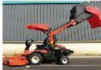
F2890E/F3890 (Frontale – Diesel)