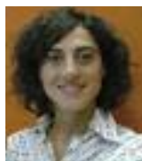
DIRETTRICE RESPONSABILE ROSSANA SPARACINO

TESTATA IN COMODATO ALL'EDITRICE CE.S.A. CENTRO SERVIZI PER L'AGRICOLTURA SRL