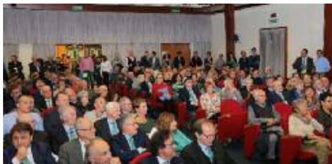
Una parte del numeroso pubblico presente nelle due sale in cui si è svolta la cerimonia.