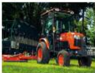
Serie B2 (Diesel) – da 19 a 29 CV