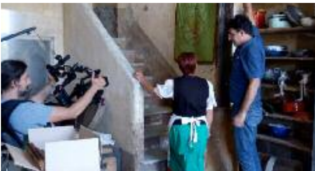
A seguire un altro momento emozionante, la presentazione del video "Coltiviamo il futuro insieme" del regista Michele Piasco (con sceneggiatura di Dora Mercurio , soggetto di Michele Piasco e Rossana Sparacino , voce narrante di Alessandra Prandi , riprese e montaggio di Federico Leccardi e coordinamento del progetto di Rossana Sparacino), che narra la storia di Confagricoltura Alessandria intersecando vicende storiche, identità associativa e aspettative per il futuro.