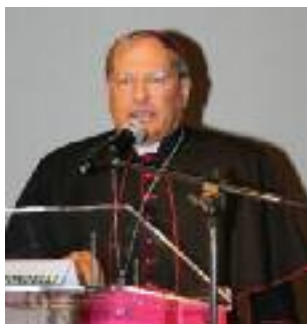
L'augurio del vescovo di Alessandria S.E. Guido Gallese .