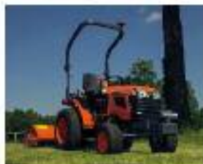
Serie B1 (Diesel) – da 12 a 24 CV