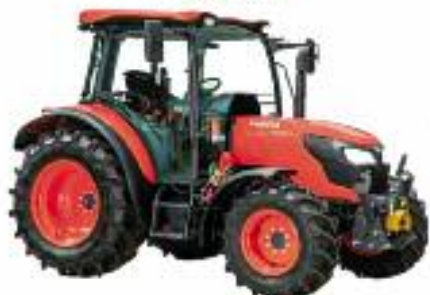
SERIE M4002 – da 66 a 78 CV

KUBOTA una gamma completa di macchine per ogni esigenza dell'agricoltore, del professionista e dell'hobbista