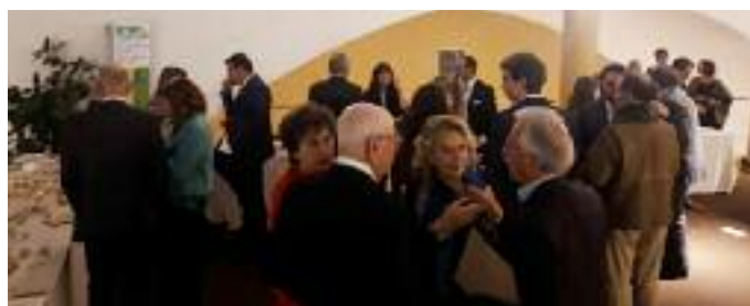
Per tutti gli intervenuti, infine, l'aperitivo e il brindisi con i vini del territorio prodotti dalle aziende associate.

A fianco i manifesti di annuncio del centenario affissi nei centri zona della provincia.