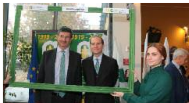
Vi è stato anche uno spazio social dedicato al Photo Booth, ovvero un angolo di intrattenimento in cui scattare foto dietro ad una cornice apposita e postarle sul proprio account Instagram, secondo la moda del momento.

Un ringraziamento particolare ai media locali che hanno dimostrato ampio interesse e partecipazione alla kermesse.