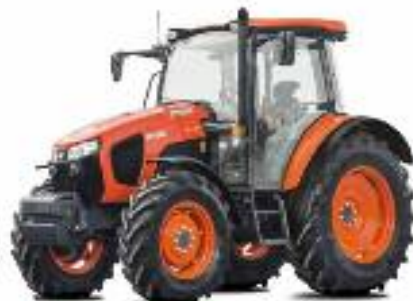
SERIE M5001 – da 95 a 115 CV