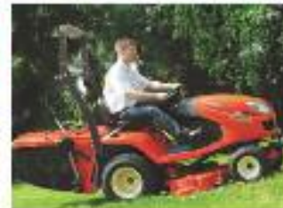
GR2120 (Diesel – posteriore)