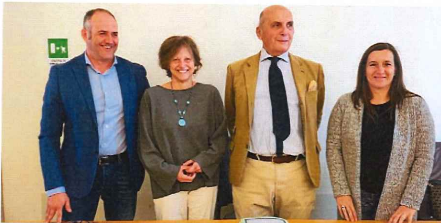
Nella sede di Confagricoltura di Alessandria è stato firmato l'accordo tra le associazioni di categoria e i sindacati